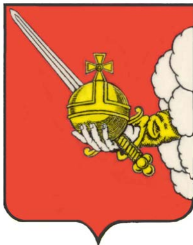
Рисунок герба города Вологды в многоцветном варианте

Приложение N 2 к решению Совета самоуправления г. Вологды (городской Думы) от 07.07.1994 N 38