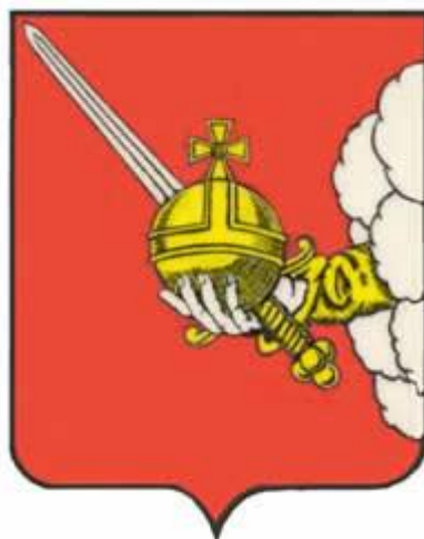
Рисунок герба города Вологды в многоцветном варианте

Приложение № 2 к решению Совета самоуправления г. Вологды (городской Думы) от 07.07.1994 г. N 38