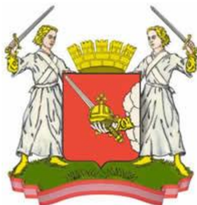
Рисунок парадной версии герба города Вологды в многоцветном варианте

Приложение № 4 к решению Совета самоуправления г. Вологды (городской Думы) от 07.07.1994 г. N 38