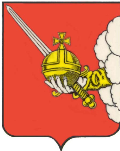
Рисунок герба города Вологды в многоцветном варианте

Приложение N 2 к решению Совета самоуправления г. Вологды (городской Думы) от 07.07.1994 N 38