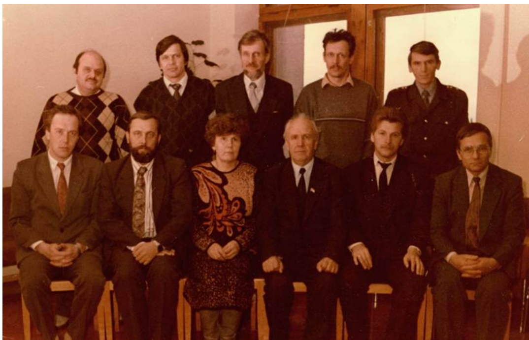
Малый Совет Вологодского городского Совета народных депутатов. 1992 год.

В октябре 1991 года в Вологодском городском Совете народных депутатов был создан Малый Совет в количестве 11 человек. В период между сессиями он осуществлял отдельные полномочия городского Совета. Заседание Малого Совета считалось правомочным, если в нем принимало участие не менее двух третей от состава (8 человек). Заседания Малого Совета проводились первый второй и четвертый четверг каждого месяца с 14.00 до с 18.45, с перерывами 15 минут после каждого часа работы. В период с конца октября 1991 года по конец сентября 1993 года проведено 34 заседания Малого Совета и принято 542 решения.