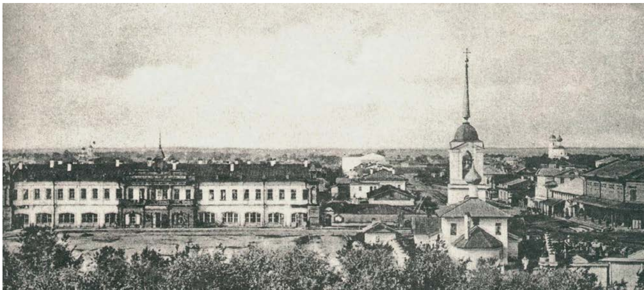
здание Вологодской городской Думы на Сенной площади. Вторая половина XIX века