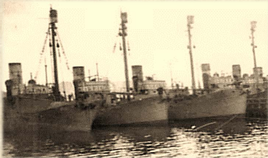
ТРАЛЕНИЕ ЯКОРНЫХ МИН